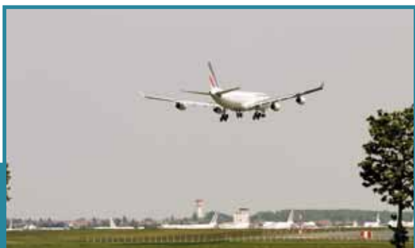
Aéroport Marcel Dassault de Châteauroux-Déols

■ Un aéroport, situé à une heure de Paris , qui permet d'accueillir des vols intérieurs et extérieurs, et ainsi de désengorger les aéroports parisiens saturés d'Orly et de Roissy. Grâce à une Ligne Grande Vitesse entre Châteauroux et Paris, la clientèle bénéficierait d'une desserte rapide vers la capitale.