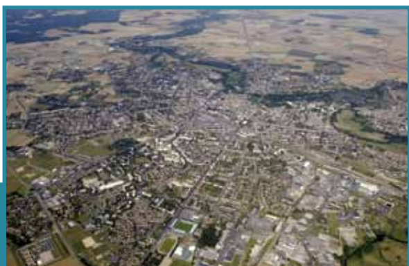
Châteauroux, une zone d'attraction de 230.000 habitants, à 2h de Paris

Le coût du tracé ouest n'est pas si éloigné du coût des autres tracés. Il représente 12,9 milliards d'euros contre 12 à 14 milliards d'euros pour les trois autres tracés. Toutefois, si on envisage le projet dans son ensemble avec le raccordement du POCL au POLT, il reste moins élevé que l'addition des coûts des deux projets pris séparément.