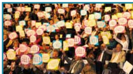
Les Indriens disent "oui" à l'arrivée de la grande vitesse dans l'Indre

Environ 1.500 Indriens ont participé au débat public organisé par la Commission Particulière du Débat Public LGV POCL, le 16 novembre 2011, à la salle multi-activités de GrandDéols. Ils étaient près de 500 lors de la réunion préparatoire à ce débat public qui avait lieu le 20 octobre 2011, à Châteauroux. Autre preuve de l'importance de ce projet aux yeux des Indriens, le nombre de pétitions envoyées et comptabilisées sur le site Internet de la Commission Particulière du Débat Public. Au 17 décembre 2011, 436 cartes avaient été signées et envoyées en soutien à l'arrivée de la grande vitesse dans l'Indre.